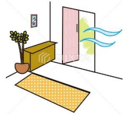
一般家庭用室内玄関