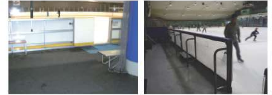
大阪市立浪速 アイススケート場