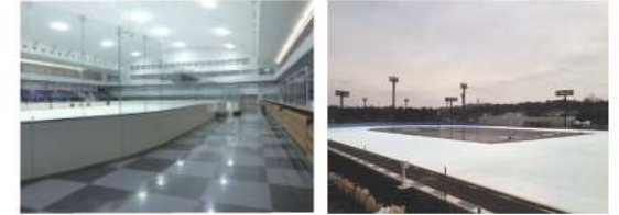
新横浜スケートセンター（特注色）