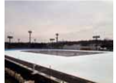
軽井沢 風越公園屋外スケートリンク