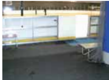
大阪市立浪速 アイススケート場