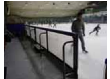
アクアピア・アイスアリーナ