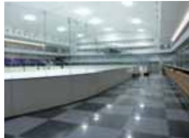
新横浜スケートセンター (特注色)