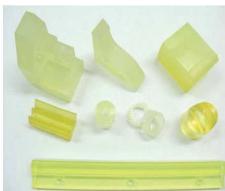
ウレタンゴム板厚さ公差