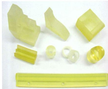
ウレタンゴム板厚さ公差